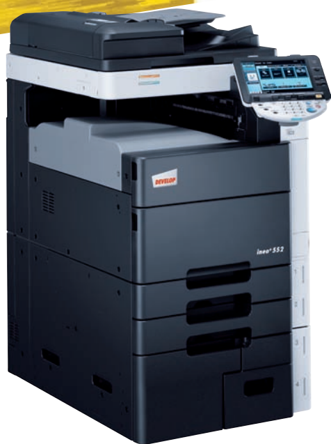
ineo+ 552 mit Ausgabe-Ablage (OT-503)