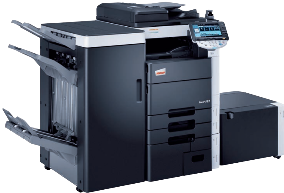
ineo+ 552 mit Heftfinisher (FS-526), Broschürenmodul inkl. Falz- und Heftereinheit (SD-508), Ablagetisch (WT-506), Biometrischem Authentifikations-Kit (AU-102) und der Großraumkassette (LU-204)